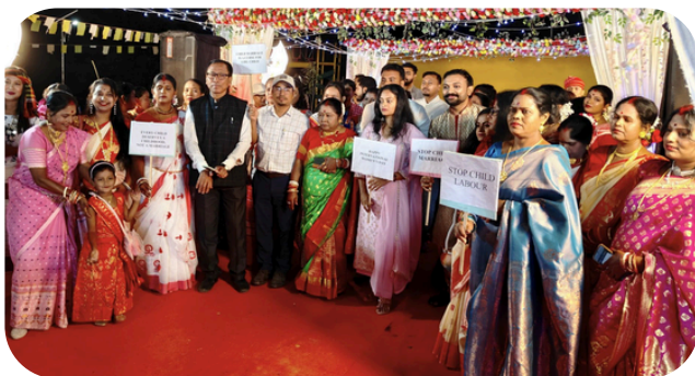
AMARPUR RD BLOCK