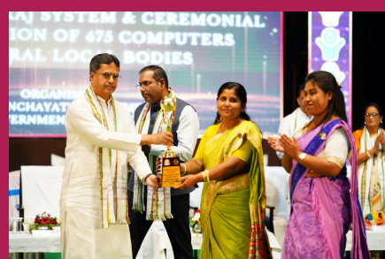
Thakchahra, Amarpur RD Block was awarded Gram Urja Swaraj Vishesh Panchayat Puraskar under the category Carbon Neutral Panchayat