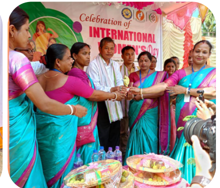
PECHARTHAL RD BLOCK