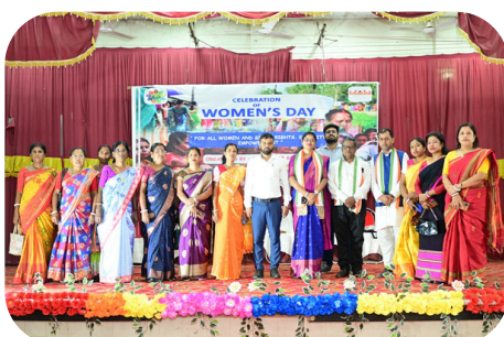
KUMARGHAT RD BLOCK