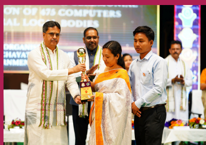
Dakshin Manubankul, Rupaichhari RD Block was awarded Deen Dayal Upadhyay Panchayat Satat Vikas Puraskar for the theme of Best Women-Friendly Panchayat in the country