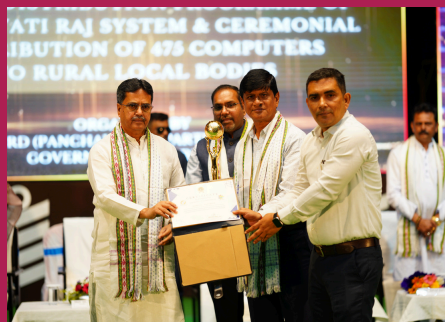
The Gomati district was awarded Nanaji Deshmukh Sarvottam Panchayat Satat Vikas Puraskar for the Best District Panchayats in the country