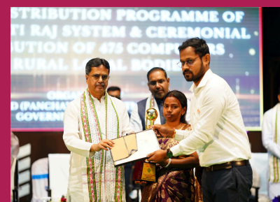
Debbari, Amarpur RD Block was awarded Deen Dayal Upadhyay Panchayat Satat Vikas Puraskar for the theme Water Sufficient Village