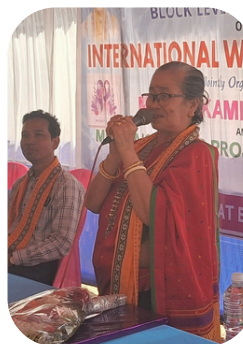
MUNGIKAMI RD BLOCK