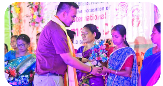
SALEMA RD BLOCK