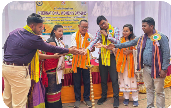
KARBOOK RD BLOCK