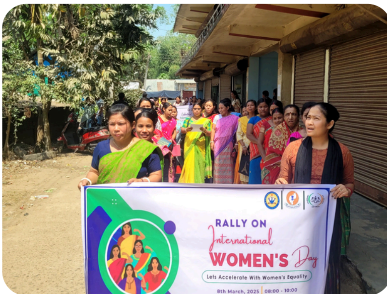
RUPAICHARI RD BLOCK