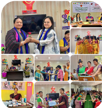
AMBASSA RD BLOCK