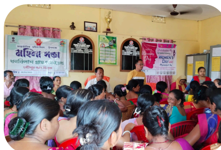
CHANDIPUR RD BLOCK