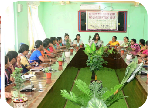
TEPANIA RD BLOCK