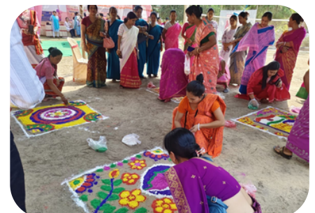
PADMABIL RD BLOCK