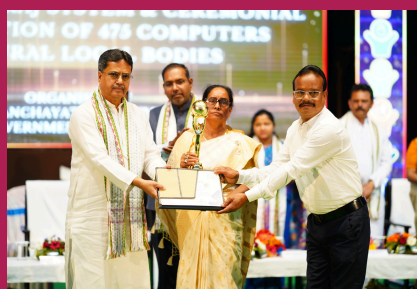
Betcherra, Kumarghat RD Block was awarded Deen Dayal Upadhyay Panchayat Satat Vikas Puraskar for the theme Poverty-Free and Enhanced Livelihood Village