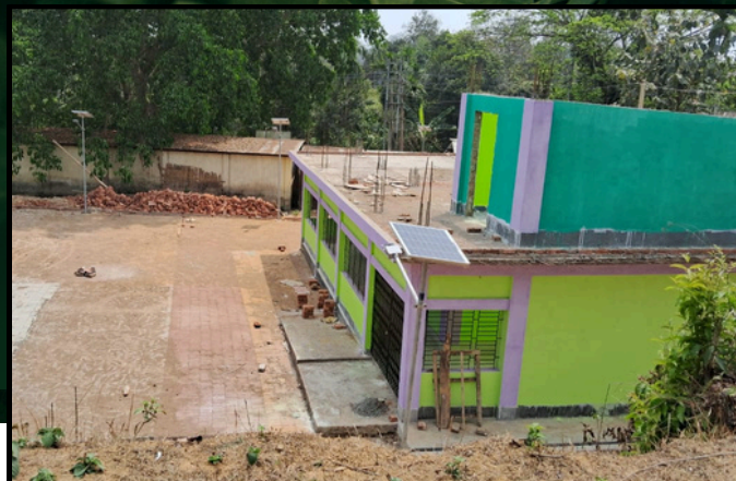
New Panchayat Bhawan Under Construction

But what makes Thakchara truly special is the power of its women. The village is led by a group of determined women who have brought remarkable changes. They have embraced solar energy, ensuring that every street is lit up with solar lights, and the Panchayat Office runs smoothly on solar power. Families with cattle have also switched to using biogas plants, making the village more eco-friendly.