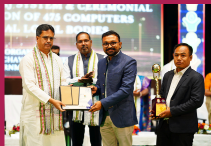
Rajkang, Amarpur RD Block was awarded Deen Dayal Upadhyay Panchayat Satat Vikas Puraskar for the theme Child-Friendly Village