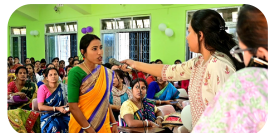
KHOWAI RD BLOCK