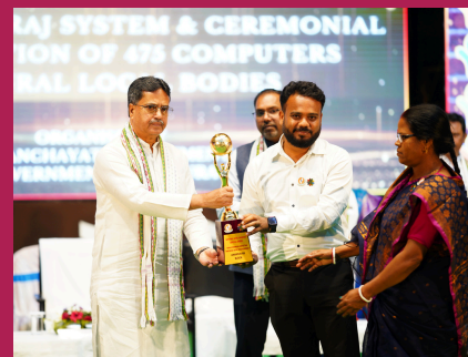
Amarpur RD Block was awarded Nanaji Deshmukh Sarvottam Panchayat Satat Vikas Puraskar for Second Best Block in the country